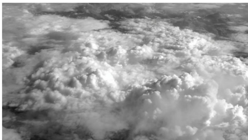
Mali Arun, Paradisus , 2016, Photo: Thomas Ozoux (KLIK HIER VOOR MEER FOTO'S)

In Foam 3h toont Foam vanaf 3 juli een korte film van fotograaf en filmmaker Mali Arun (1987, Frankrijk). Voor haar camera ontvouwt zich een adembenemend landschap in zwart-wit, vol weelderige begroeiing en overweldigende watervallen. Arun reisde naar het ogenschijnlijk ongerepte natuurreservaat Krka in Kroatië, op zoek naar een soort oerbeeld van het aardse Paradijs.